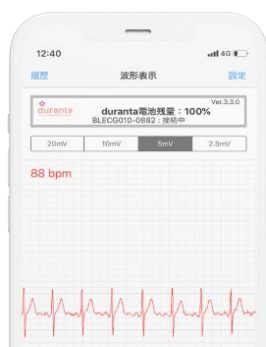
小型心電計「デュランタ」